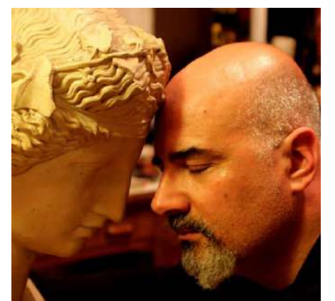
Rubrica a cura del dott. Alessandro Spampinato Psicologo e cantautore

sone hanno dato il peggio di sé fino a schierarsi gli uni contro gli altri anche dentro le stesse famiglie. Spero che in questa seconda partita "dell'emergenza energetica" si inizi a vedere più solidarietà e amicizia visto che su questa "Nave da Crociera" ci siamo proprio tutti noi e, come da copione, il capitano che ha fatto "l'inchino" agli scogli si è dato con la sua scialuppa personale. L'augurio che faccio è che sarebbe veramente bello iniziare a vedere più umanità e solidarietà tra le persone visto che l'inverno sarà lungo, freddo e difficile per tutti.