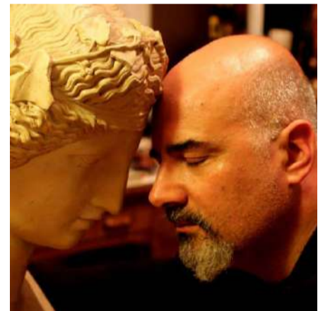
Rubrica a cura del dott. Alessandro Spampinato Psicologo e cantautore

che e insostituibili? Cosa vuol dire essere e fare comunità? In questo articolo vi voglio dare solo uno spunto di riflessione per attivare in voi il processo di consapevolezza sul presente e sul futuro che ci aspetta. Provate a immaginare un futuro in cui non esiste più la scuola perché le lezioni e gli esami vengono svolti da casa online, in cui non ci sono più il teatro, il cinema, lo sport, i concerti, le feste e le ricorrenze religiose perché tutto sarà trasmesso sul web a casa e un mondo in cui quando usciremo avremo sempre guanti, mascherina e staremo a un metro di distanza gli uni dagli altri e pagheremo i nostri acquisti strisciando il microchip installato sul polso o sul dorso della nostra mano. In uno scenario del genere valutiamo bene cosa si perderebbe e capiremo il valore imprescindibile e sacro della dimensione umana per il senso della nostra vita qui sulla terra.